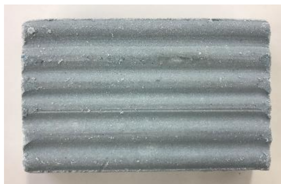
＜ランドリースクラバー 表面＞

洗たく板のような凹凸の面がお洗たくの際に空気を含むことで、従来品に比べて約1.5倍の泡立ちの良さを実現するなど、泡自体もきめ細やかな質の高いものとなっています。