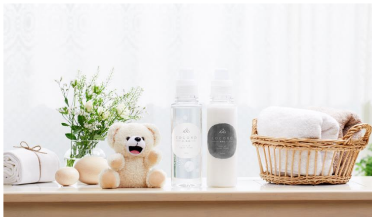
左からファーファ ココロ 洗たく用洗剤、ファーファ ココロ 柔軟剤

衣料用洗剤・柔軟剤などを製造・販売するNSファーファ・ジャパン株式会社（本社：東京都墨田区/代表取締役社長：里村 治）は、2017年1月より販売している「ファーファ ココロ」を好評につきリニューアルし、2019年4月初旬より全国で販売を開始いたします。