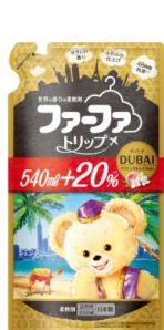
ファーファトリップ ドバイ

当社は今後も消費者視点の商品開発を行っていくことで、より多くの家族がお洗たくを通じて「家族と過ごす時間」を充実したものにできるよう、新たなライフスタイルを提案していきます。