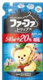
ファーファトリップ スコットランド