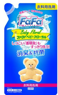
ファーフア液体洗剤 ベビーフローラル