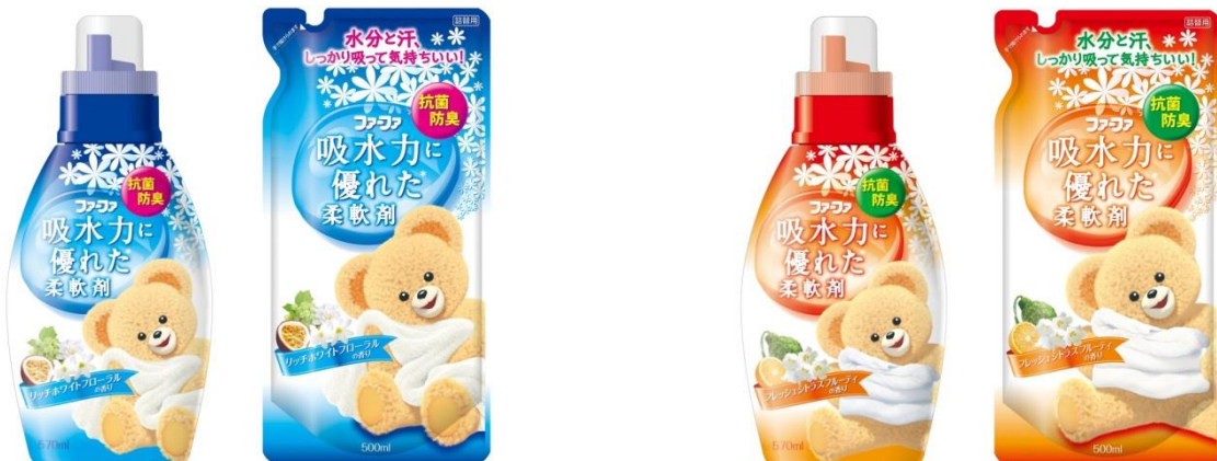
ファーフア吸水力に優れた柔軟剤 リッチホワイトフローラル

※ハイブリッドカチオン・・・独自のメカニズムを持つ、水との親和性の高い界面活性剤のこと。