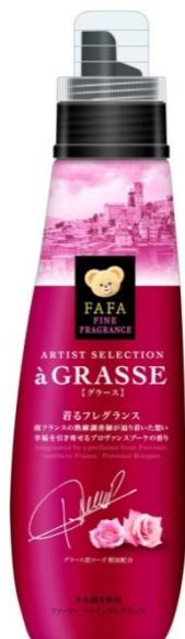
ファーファ ファインフレグランス ARTIST SELECTION 【à GRASSE】

尚、今回の新ライン誕生を機に、従来の「ポーテ」と「オム」の高級感を更に感じられるものにリニューアルするとともに、これらの香りを日常生活の中で楽しめるミストタイプも発売を予定しています。